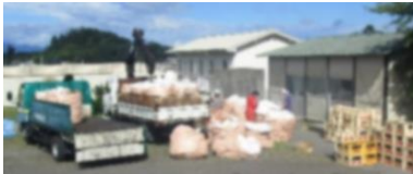
PTA 親子資源回収 8/25