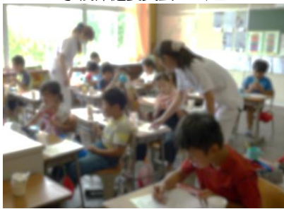
ブラッシング指導3年 8/30