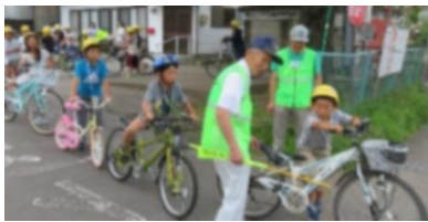
夏休み交通安全教室 (各地区)