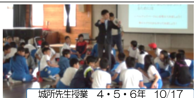
城所先生授業 4・5・6年 10/17