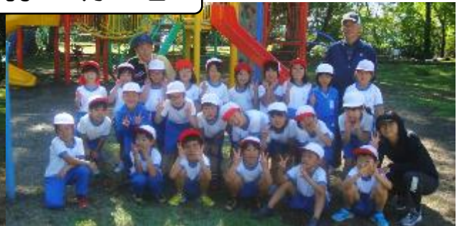
1年生遠足 鼻顔稻荷・公園