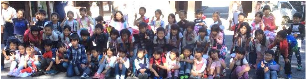
2年遠足 小諸懐古園・佐久平駅