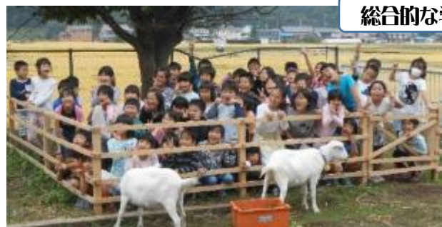
2年ヤギの飼育 ヤギ牧場