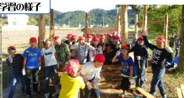
5年2組 ウッドハウス作り