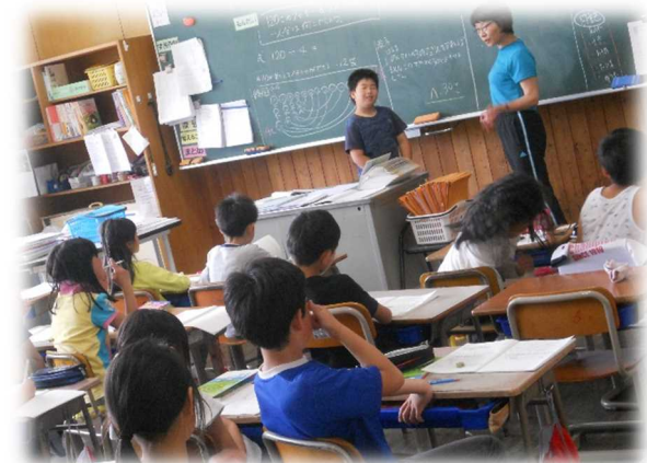
先生や友だちの話を真剣に聞く3年生

校長講話や全校集会など全校が集まる場面だけでなく、毎日の授業でもこの「聞き方」がしっかりと身につくように指導していきたいと思います。学校で身に付けたことが、家庭や地域での子どもの姿になっていけば本物です。子どもたちの「聞き方」を育てるためには、私たちまわりの大人も、しっかりと子どもの声に耳を傾け、よいモデルになりたいですね。