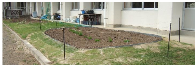
多目的室南側の花壇 ボランティアの方に芝生を張り直していただきました。

5月30日(水)に「東の子応援団」の総会を行います。この「東の子応援団」を中心に、今後も地域とともに歩む学校づくりを目指してまいります。今後の活動の様子は、この「学校だより」でお伝えしていきます。