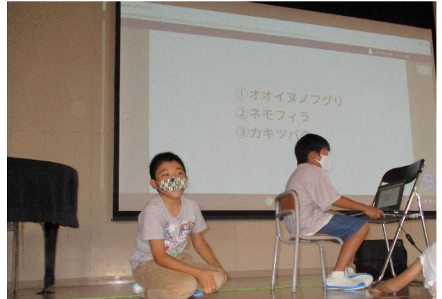
4年生 タブレット活用によるクイズ大会