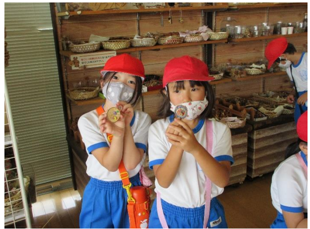
2年生 遠足「キーホルダーづくり」