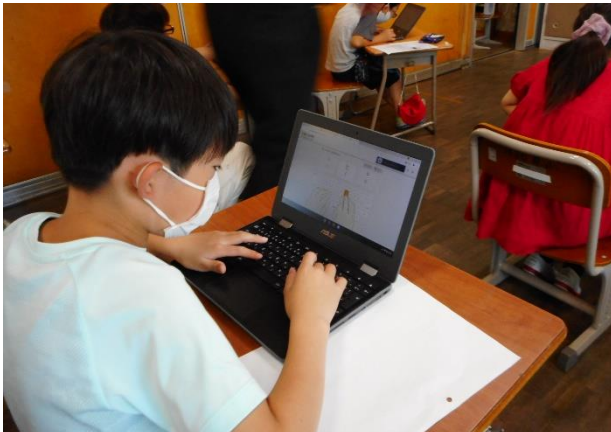
3年生 文字入力練習