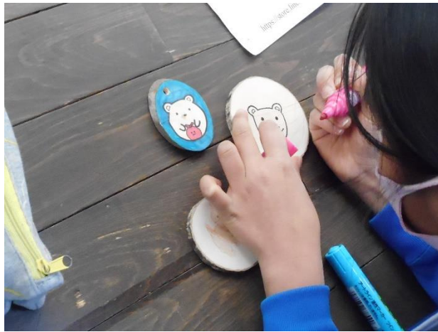
4年生みどりの教室