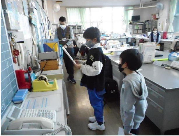
3学期始業式の発表（職員室より）