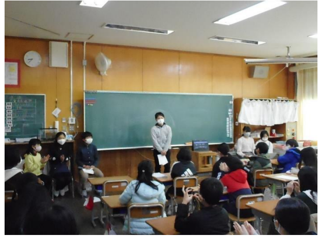
教室からリモートによる立会演説会