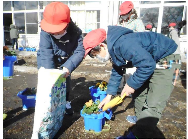
卒業式に飾るパンジーの植え替え