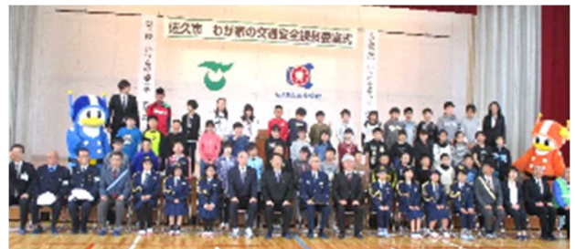
「わが家の交通安全課長」委嘱式 6年 4/22