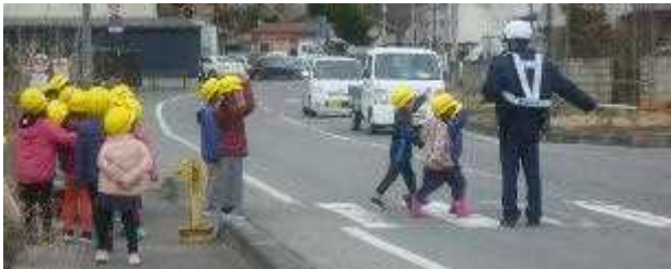
交通安全教室 1・2年生 4/12